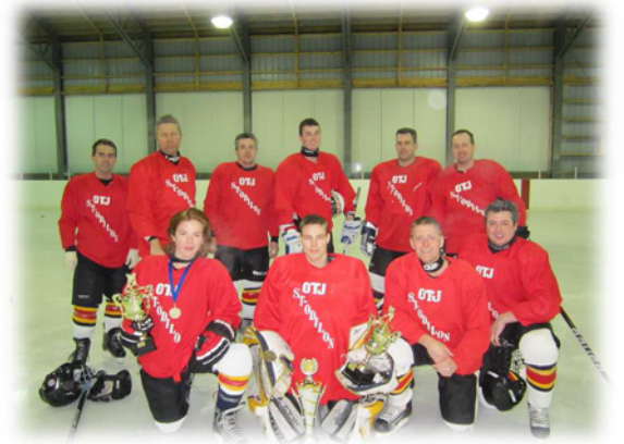
Accomodation St-Odilon - Équipe gagnante saison régulière