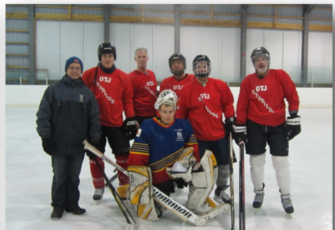
Finalistes Classe C - Les Bisons