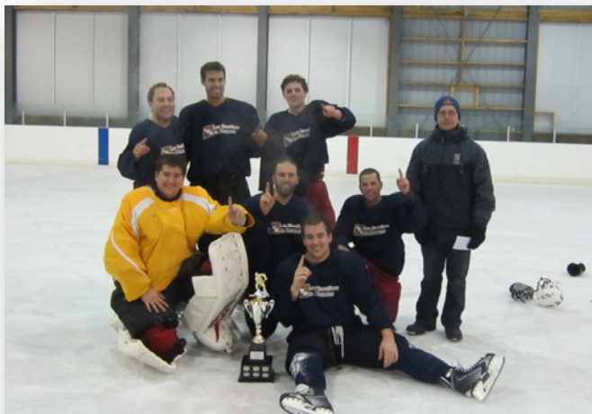
Gagnants Classe C - Escalier de Beauce