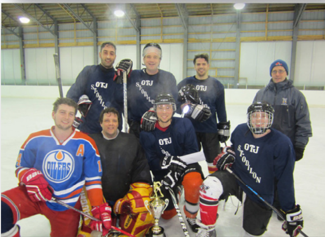
Gagnants Classe B - Massothérapie GSP