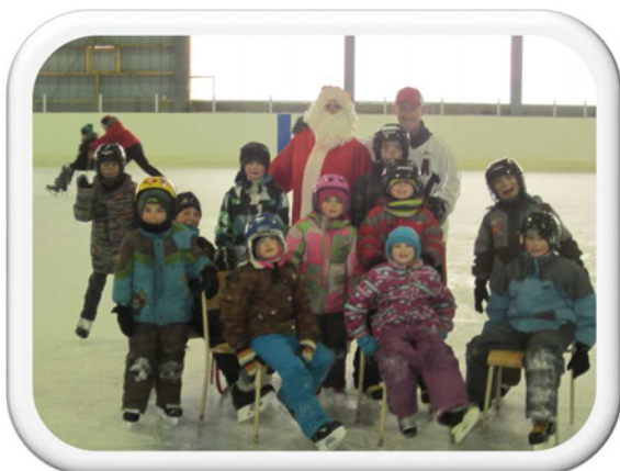
Le 20 décembre nous avons eu la visite du Père Noël